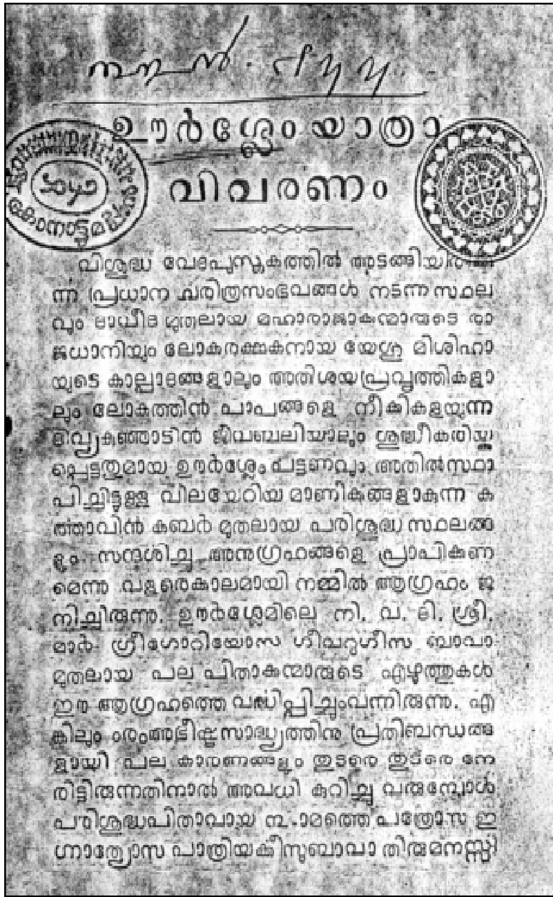
(1895 ലെ ഒന്നാം പതിപ്പിന്റെ പ്രഥമ പേജ്. പാമ്പാക്കൂട കോനാട്ട് ലൈബ്രറി. നമ്പർ 188)